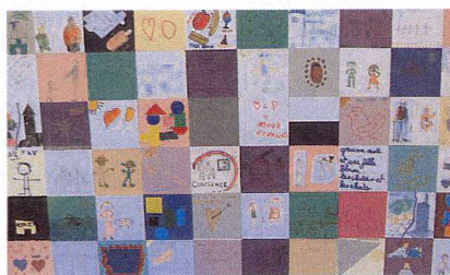
Ci-dessus, œuvre collective de l'Esat, à gauche, de l'IME et ci-dessous, du Foyer. A droite, des écoliers de maternelle visitant l'exposition.