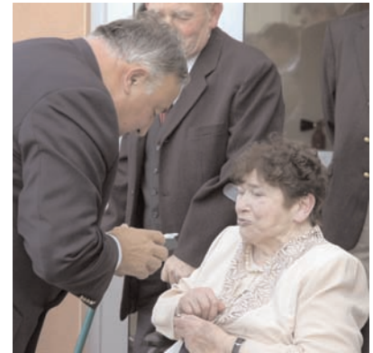
Avec Gérard Larcher, Maire de Rambouillet