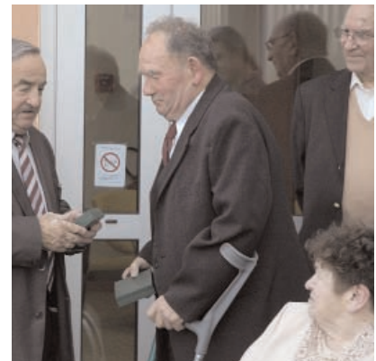
Avec Élio Zannier, Maire de Poigny-la-Forêt