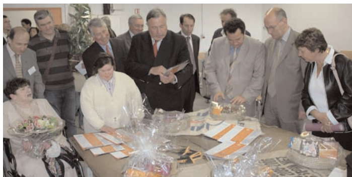
La visite des nouveaux ateliers.