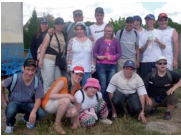
Tous les participants au "Vélorail".

mélangé les deux équipes et ça nous a plu ! Puis nous avons fait un pique-nique.