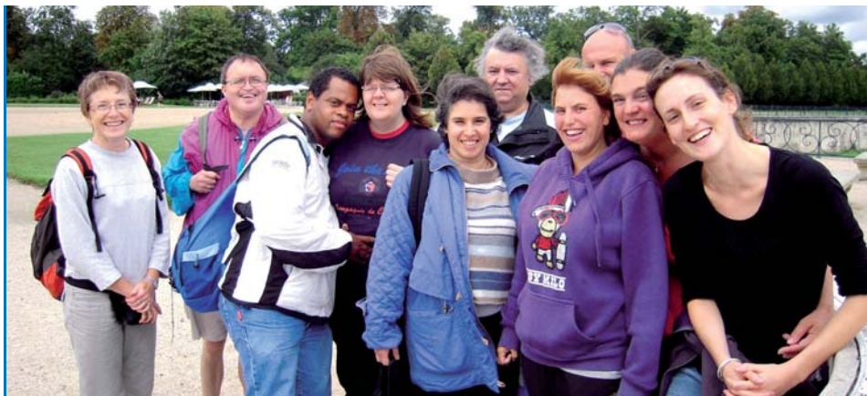
Le groupe du SAVS à Saint Germain-en-Laye

Cette sortie “temps libre” a permis de réunir jeunes et moins jeunes, travailleurs et retraités, dans une ambiance estivale. Les “Blocs-notes” ponctuent l’été de moments conviviaux, notamment pour tous ceux qui n’ont pas l’occasion de partir en vacances.