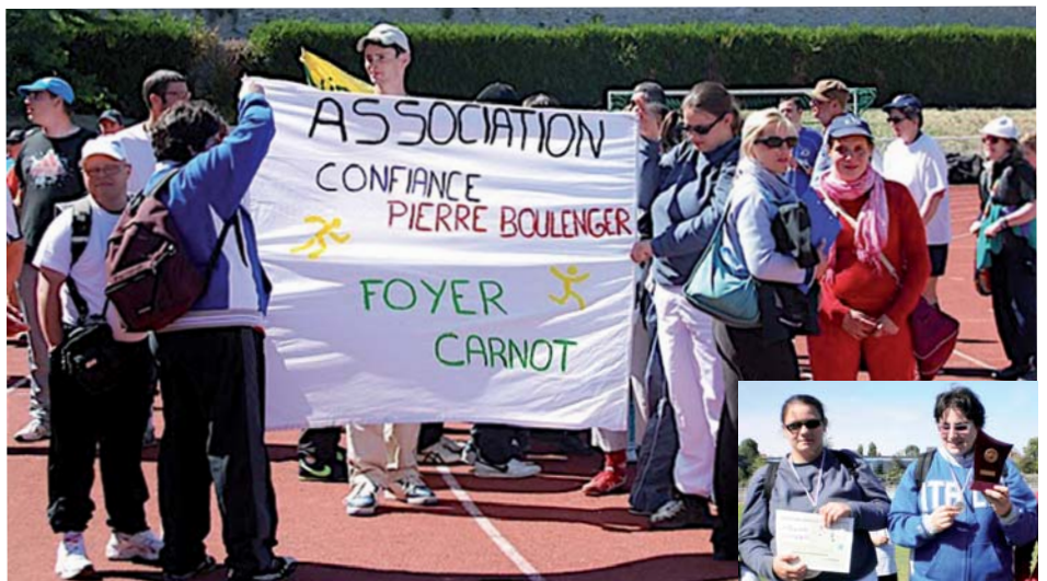
Les sportifs au Stade Montbaron de Versailles, le 28 mai 2011

Vous êtes des parents dont les enfants sont accueillis dans l'un de nos 9 établissements. Votre adhésion est nécessaire pour continuer notre action et créer des structures complémentaires à celles qui existent déjà. Pour adhérer, c'est simple... et peu onéreux : 15 € à adresser à l' Association Confiance - Pierre Boulenger.