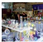
Le stand "brocante"

Bouquet final des activités annuelles, LA KERMESSE de l'Association a tenu ses promesses : soleil, ambiance festive, échanges chaleureux avec un large public. Les familles et les bénévoles ont fait de cette journée, autour des nombreux stands, une totale réussite.