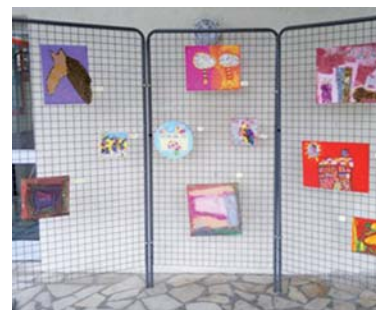
Les créations, regroupées par ateliers, du papier mâché à la peinture, en passant par de belles réalisations en mosaïque.