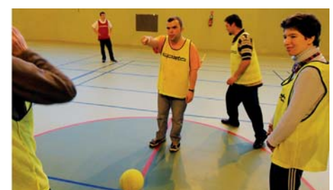
L'équipe de l'ESAT Pierre Boulenger, venue à 15 à Fontenay-le-Fleury pour participer au tournoi.