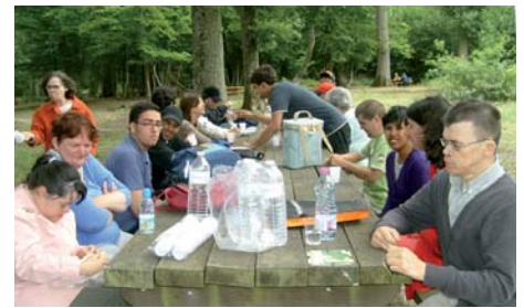
Le pique-nique du CAJ au grand complet